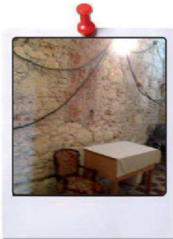
Restauro intonaci locali della Sacrestia; parete con nicchia murata.