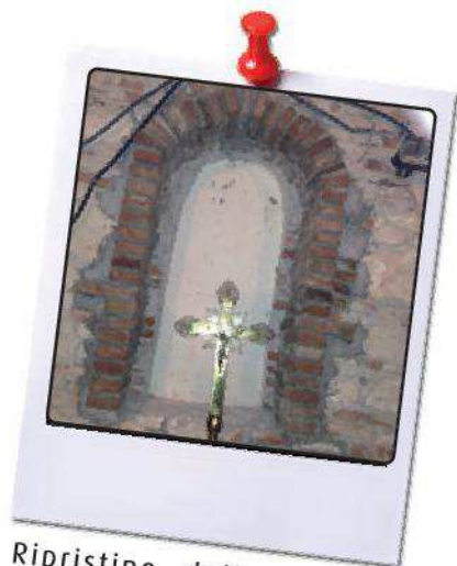
Ripristino della nicchia preesistente nella Sacrestia.