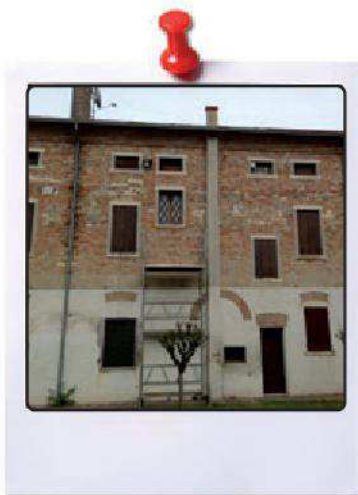
Istallazione con verniciatura di alcuni balconi sui locali parrocchiali.