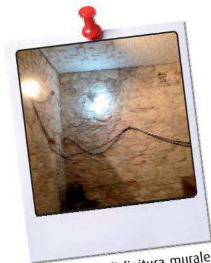
Inizio lavori di finitura murale nei locali della Sacrestia.