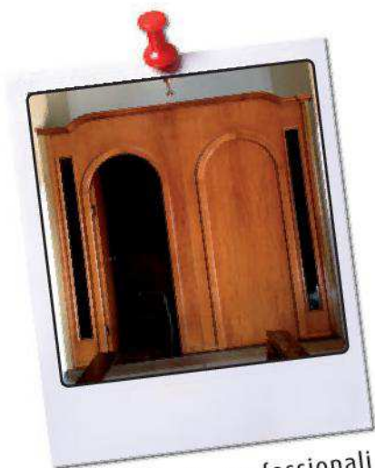
Rimontaggio confessionali esistenti nella chiesa, con verniciatura e impianto luce.