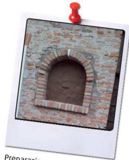
Preparazione della nicchia per la sistemazione di una Madonnina a protezione del Circolo Noi.